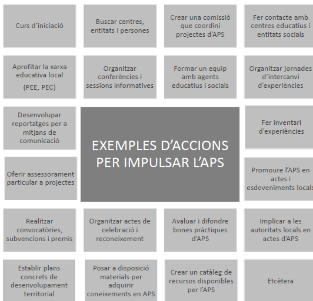
Gràfic 3. Exemples d'accions per impulsar l'aprenentatge servei (APS)

De forma complementària als processos descrits en l'apartat anterior, trobem múltiples accions que fomenten l'impuls de l'aprenentatge servei. Existeixen diferents propostes que ajuden a difondre l'aprenentatge servei i que són bàsiques si es vol potenciar els projectes educatius. És per aquest motiu que descriurem nou accions, entre d'altres de possibles, que són fonamentals per a l'èxit dels projectes d'aprenentatge servei.